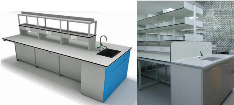
Slika 2. Prikaz radnog stola za natjecatelje s policama i sudoperom